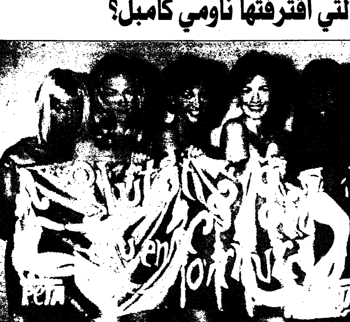
عازرات، بينهن ناومي كامبل (اليمين) ترعن لائحة لسر بريتن، وعليها كتابة: «أفضل العري على ارتداء الفرو».